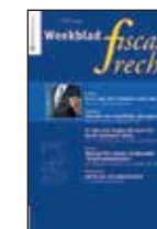
Weekblad Fiscaal Recht