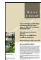
Milieu & Recht