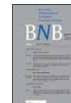
Beslissingen Nederlandse Belastingrechtspraak