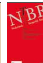
Nederlands tijdschrift voor Burgerlijk recht