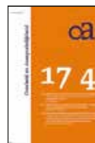
Overheid & Aansprakelijkheid