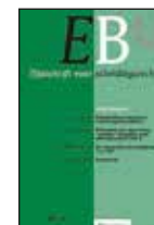
TS voor Scheidingsrecht