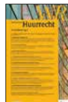
WR voor Huurrecht