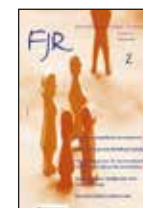
Tijdschrift Familie & Jeugdrecht