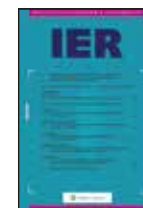
IE & Reclamerecht