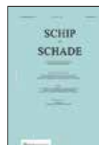
Schip & Schade