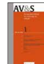
Aansprakelijkheid, Verzekering & Schade