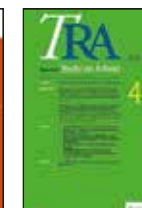
Tijdschrift Recht & Arbeid